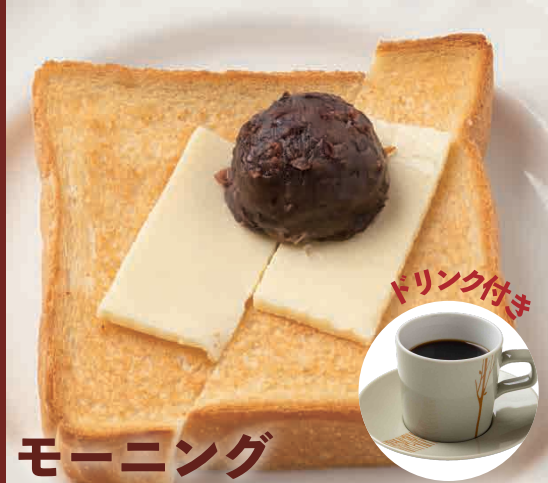
モーニング 小倉あんトーストセット 税込 550円