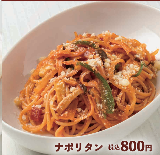
ナポリタン 税込 800円