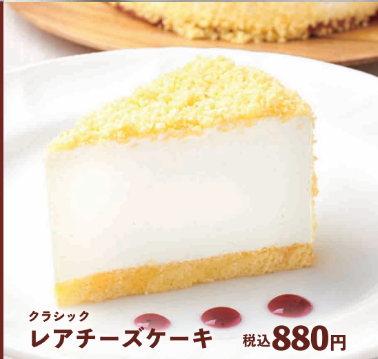
クラシック レアチーズケーキ 税込 880円