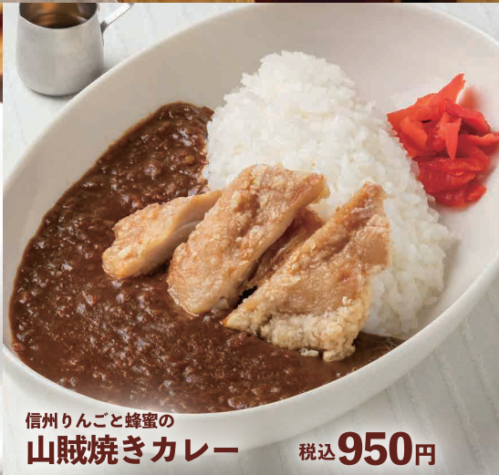
信州りんごと蜂蜜の 山賊焼きカレー 税込 950円