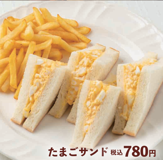
たまごサンド 税込 780円