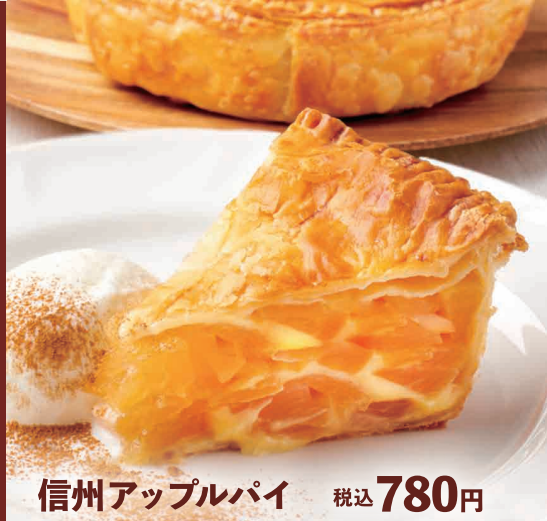
信州アップルパイ 税込 780円