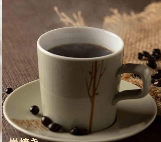
炭焼き あずさブレンド珈琲 税込 450円