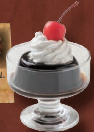
炭焼き 珈琲ゼリー 364円 (税込400円)

あずさ珈琲炭焼きブレンド珈琲を使用。 炭焼き珈琲独特の風味と味わいをお楽しみください。