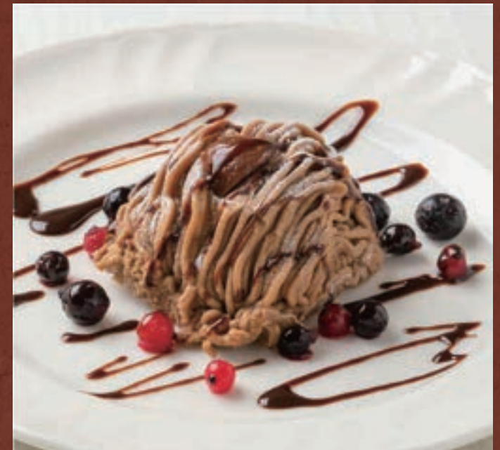
渋皮栗のモンブラン 619円 (税込680円)