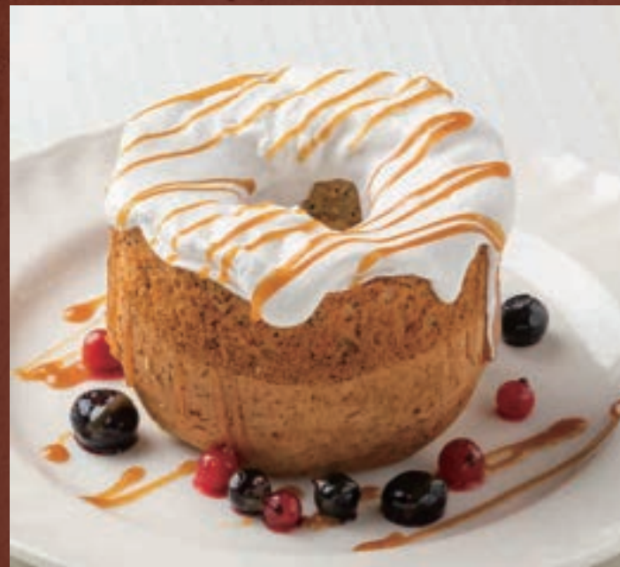
店内焼き 紅茶シフォンケーキ 619円 (税込680円)