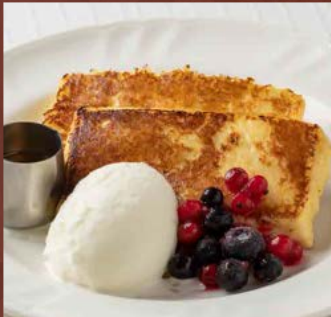
信州ミルクの フレンチトースト 710円 (税込780円)