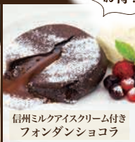
信州ミルクアイスクリーム付きフォンダンショコラ