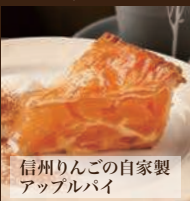
信州りんごの自家製アップルパイ