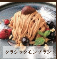
クラシックモンブラン