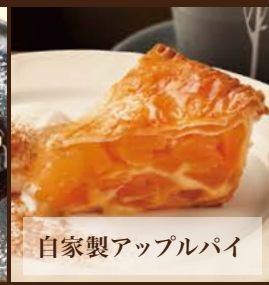
自家製アップルパイ