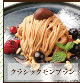
クラシックモンブラン