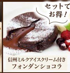
信州ミルクアイスクリーム付き フォンダンショコラ