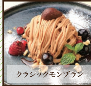
クラシックモンブラン