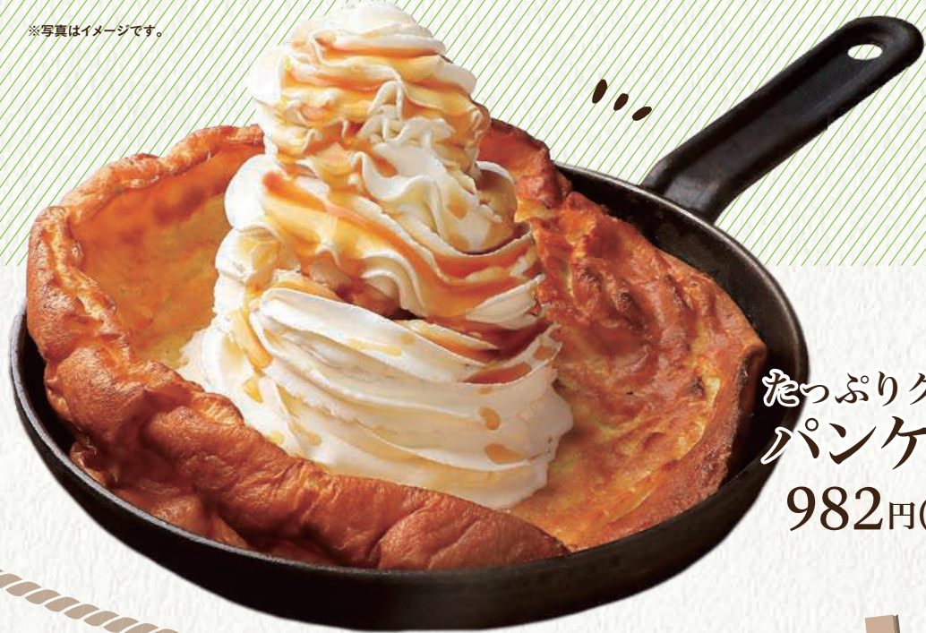
たっぷりクリームの パンケーキ 982円(税込1,080円)