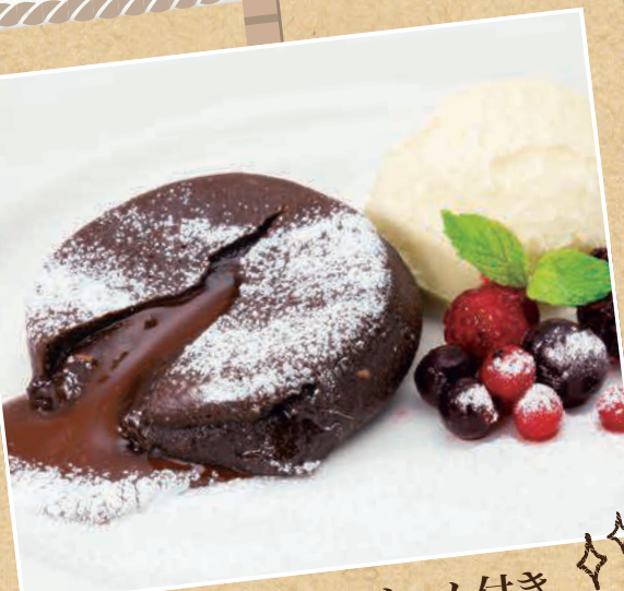
信州ミルクアイスクリーム付き フォンダン ショコラ