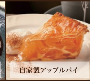
自家製アップルパイ