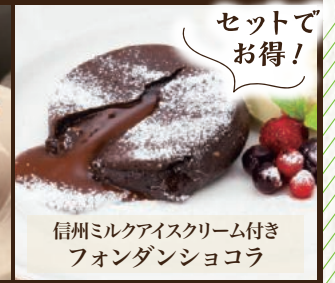
信州ミルクアイスクリーム付き フォンダンショコラ