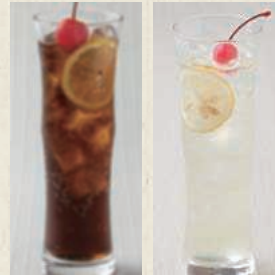
クラフトコーラ レモンスカッシュ