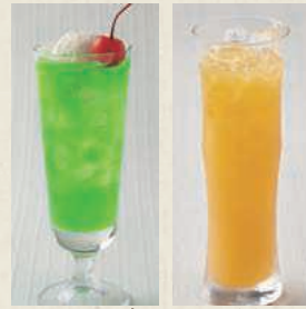
クリームソーダ オレンジジュース