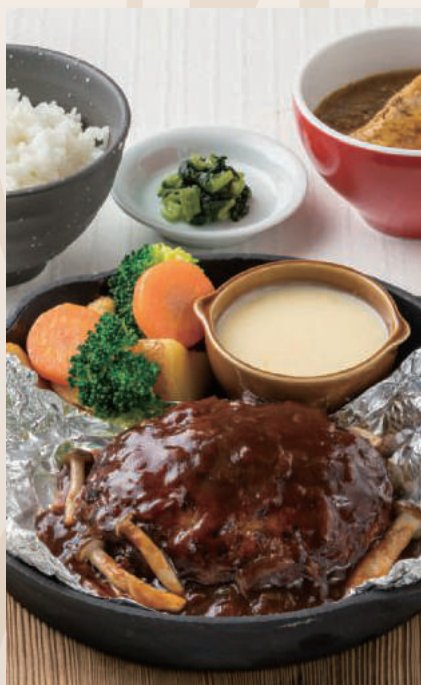
包み焼き“チーズフォンデュ” ハンバーグ定食