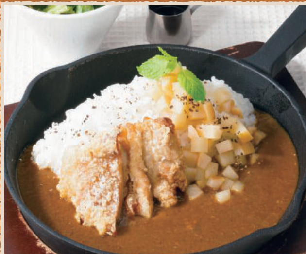
山賊カレー サラダ付き 1,164円 (税込1,280円)