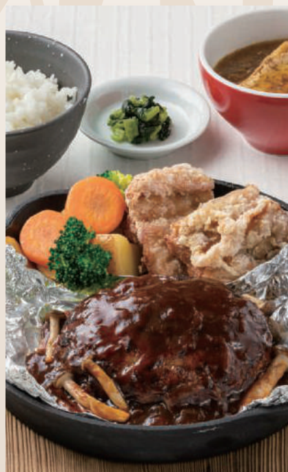
包み焼きハンバーグ& 山賊焼き定食