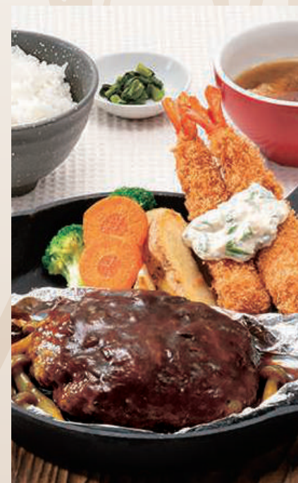
包み焼きハンバーグ& エビフライ(2尾)定食