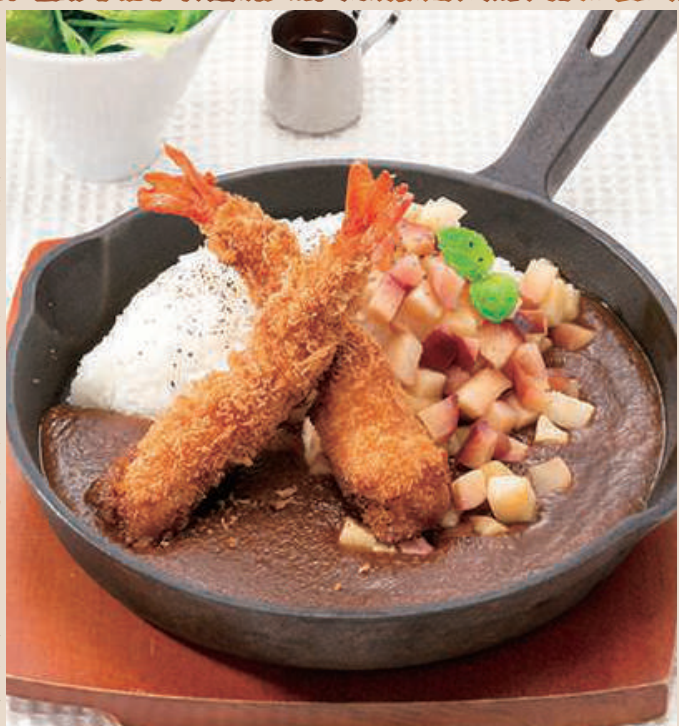
エビフライカレー サラダ付き 1,528円 (税込1,680円)