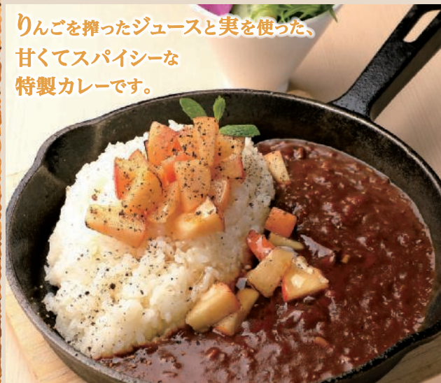
りんごと信州はちみつのカレー サラダ付き 982円 (税込1,080円)