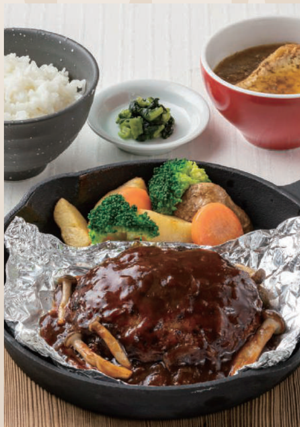
包み焼きハンバーグ定食 ～信州きのこのデミグラス～