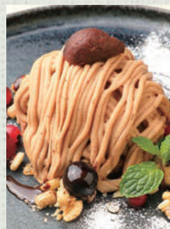
クラシック モンブラン