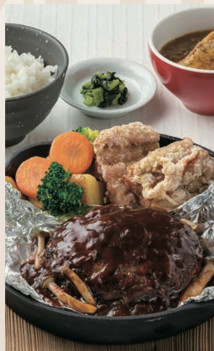
包み焼きハンバーグ& 山賊焼き定食