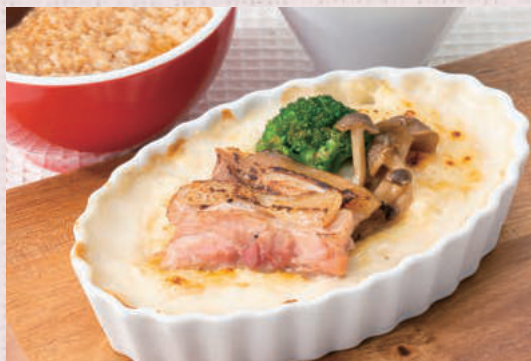
信州ミルクのグラタン スープ・サラダ付き