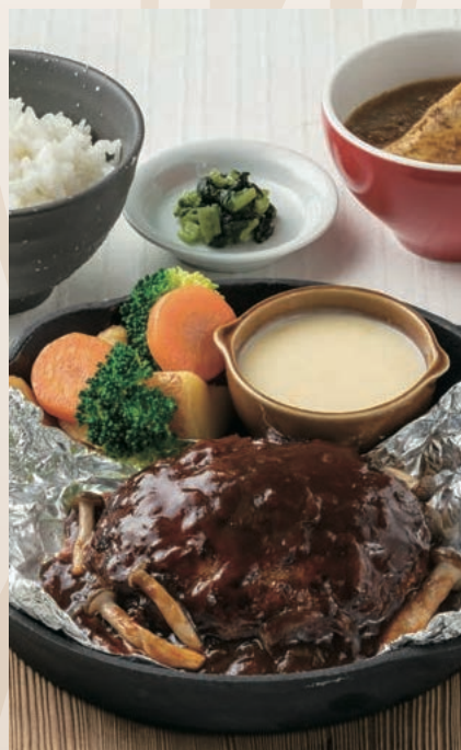
包み焼き“チーズフォンデュ” ハンバーグ定食