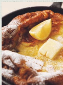
信州ミルクの パンケーキ