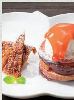
信州ミルク アイスクリーム付き 焼きりんご