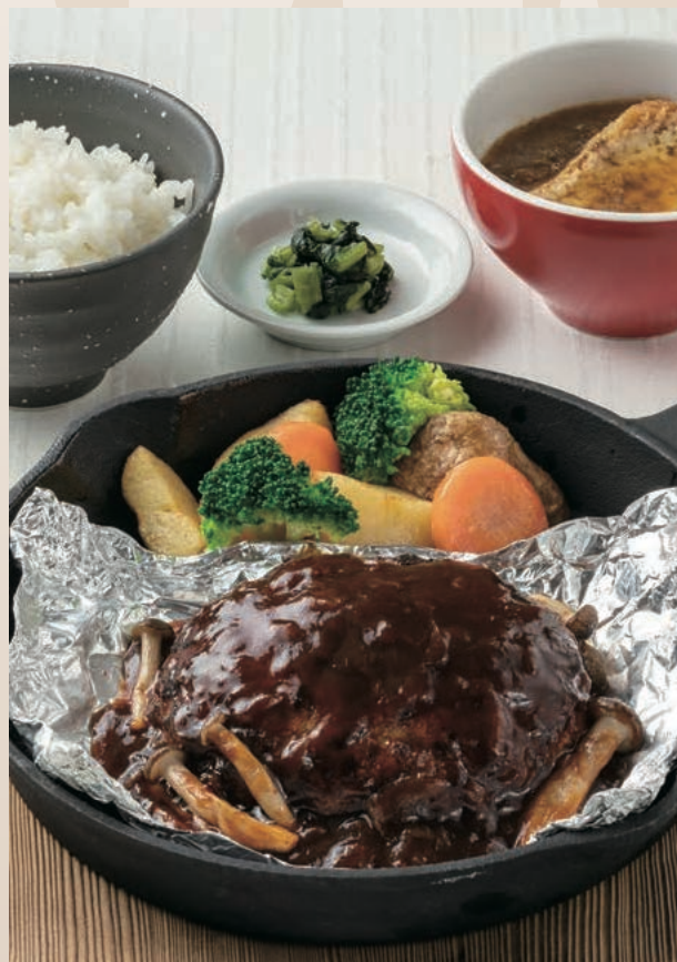
包み焼きハンバーグ定食 ～信州きのこのデミグラス～