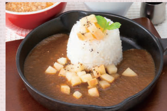
りんごと信州はちみつのかレー (ハーフ) スープ・サラダ付き