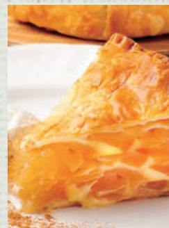
自家製 アップルパイ