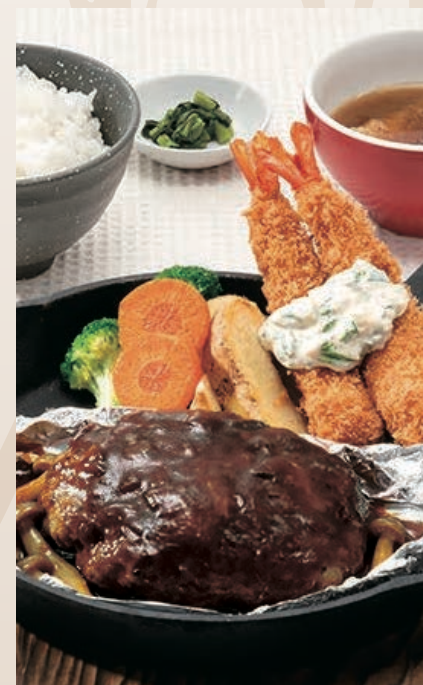
包み焼きハンバーグ& エビフライ(2尾)定食