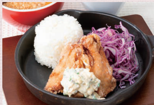
信州郷土料理山賊焼き スープ・サラダ付き