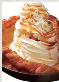
たっぷりクリーム パンケーキ