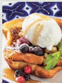
信州ミルクの とろける フレンチトースト