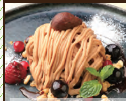
クラシックモンブラン