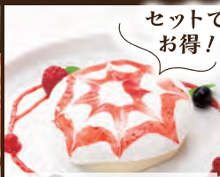
信州ミルクのおふれる ロールケーキ