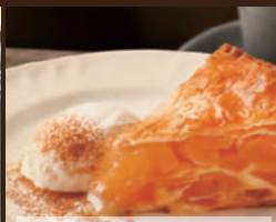
自家製アップルパイ