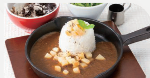
りんごと信州はちみつのカレー (ハーフ) スープ・サラダ付き