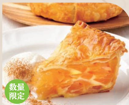
自家製 アップルパイ