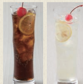
クラフトコーラ レモンスカッシュ