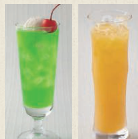
クリームソーダ オレンジジュース