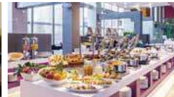
信州名物や地元食材が揃った洋和朝食buffet