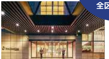
ホテルの正面玄関前からそのまま白馬へ直行

https://go-alpicohotels.reservation.jp/ja/hotels/buena-vista