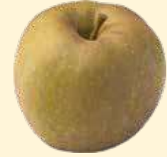
ベルドボスクール