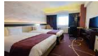
城下町松本を望む全190室のゲストルーム