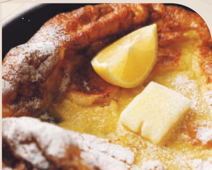
信州ミルクのパンケーキ