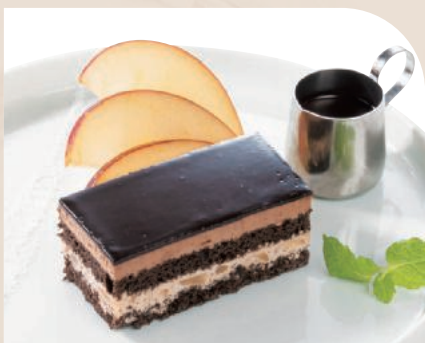
りんごのザッハトルテ セミフレッド仕立て