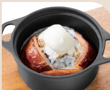
ダッチオーブンの 蜜トロ 焼きりんご〜ショコラ〜