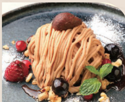
クラシックモンブラン