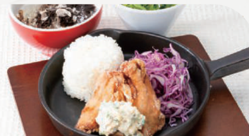
信州郷土料理山賊焼き スープ・サラダ付き

年末年始期間 (2025.12.27~2026.1.4) こちらの商品の販売を 休止しております。