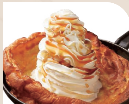
たっぷりクリーム パンケーキ