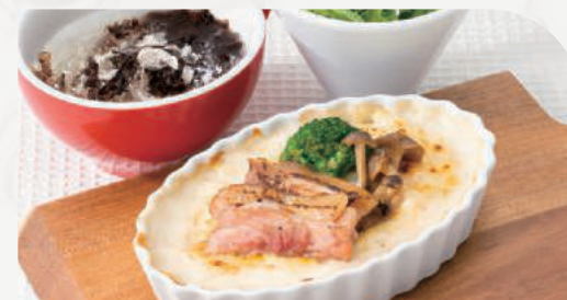
信州ミルクのグラタン スープ・サラダ付き