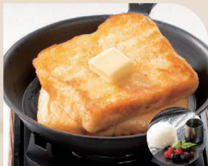
フレンチトースト 信州ミルクアイスクリーム