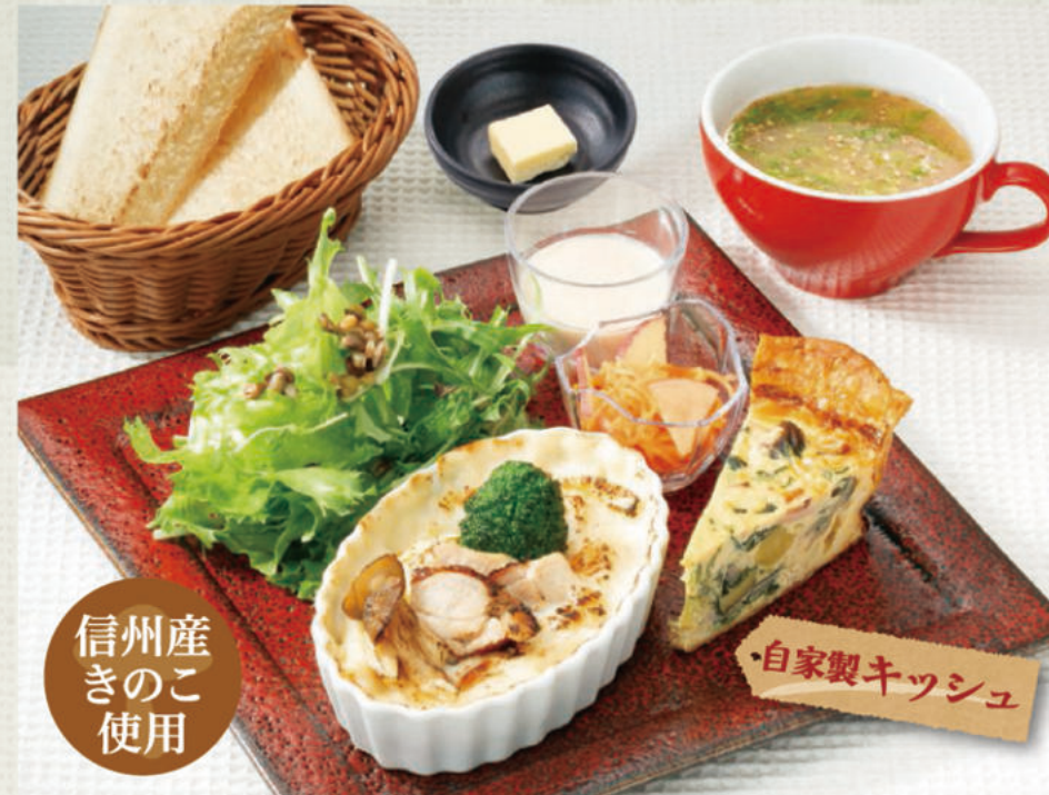
信州産きのこ使用 信州ミルクのグラタン定食 1,364円(税込1,500円)