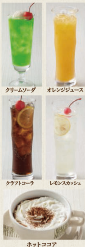
クリームソーダ オレンジジュース