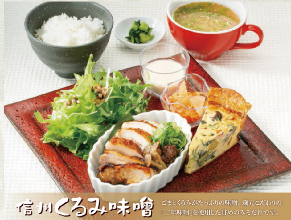
信州くるみ味噌 信州くるみ味噌の鶏もも焼き定食 1,410円(税込1,550円)

一緒にどうぞ 定食注文の方限定 一部珈琲・紅茶料金 半額 ドリンクは右ページからお選びください。