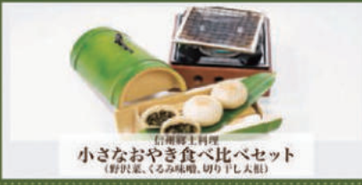
信州郷土料理 小さなおやき食べ比べセット (野沢菜、くるみ味噌、切り干し大根)