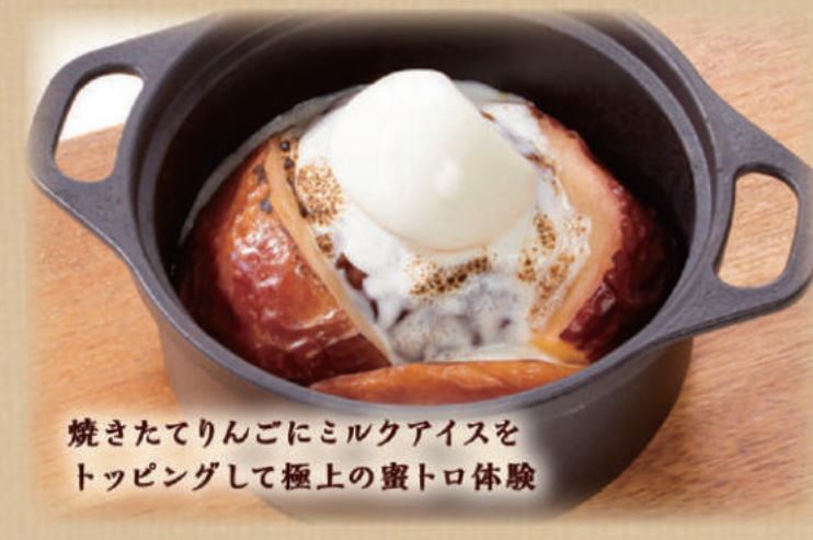
焼きたてりんごにミルクアイス トッピングして極上の蜜トロ体験