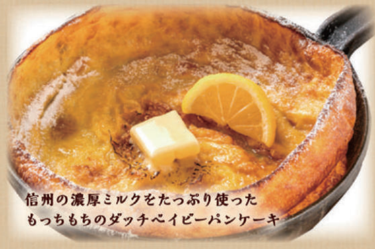
信州の濃厚ミルクをたっぷり使った もっちりもちのダッチベイビーパンケーキ