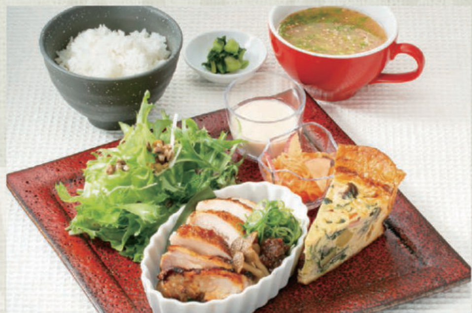
信州くるみ味噌の鶏もも焼き定食 1,410円(税込1,550円)

ご一緒にどうぞ 定食注文の方限定 一部珈琲・紅茶料金 半額 ドリンクは右ページからお選びください。