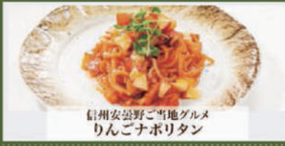
信州安曇野ご当地グルメ りんごナポリタン