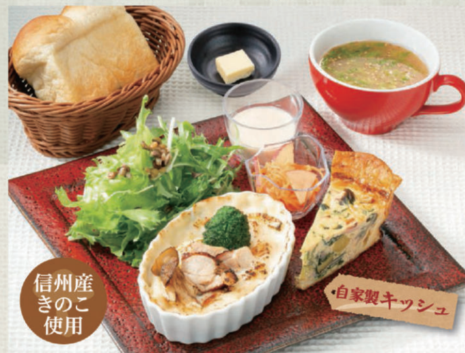
信州産きのこ使用 信州ミルクのグラタン定食 1,319円(税込1,450円)