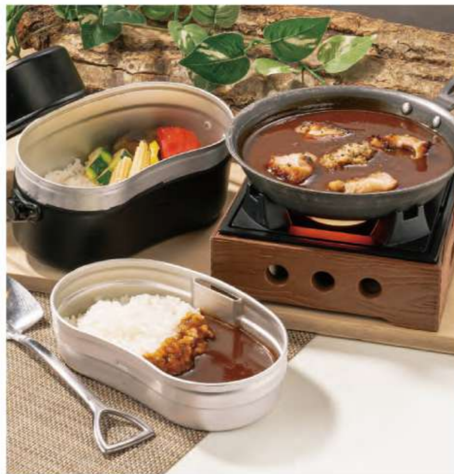
信州きのここと鶏肉のカレー ¥1,119 (税込¥1,230)