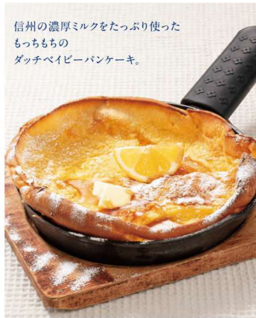
信州ミルクのパンケーキ ¥800 (税込¥880)