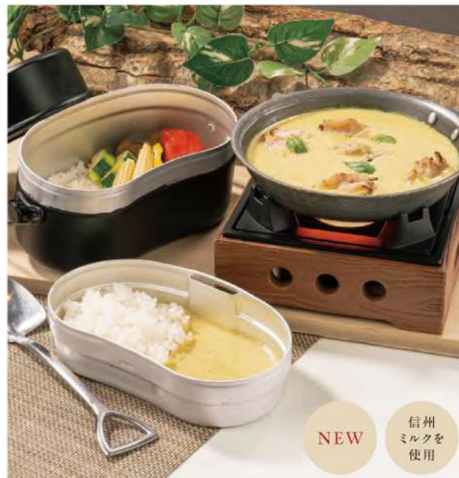
信州ミルクのグリーンカレー ¥1,164 (税込¥1,280)