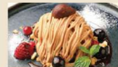
クラシックモンブラン