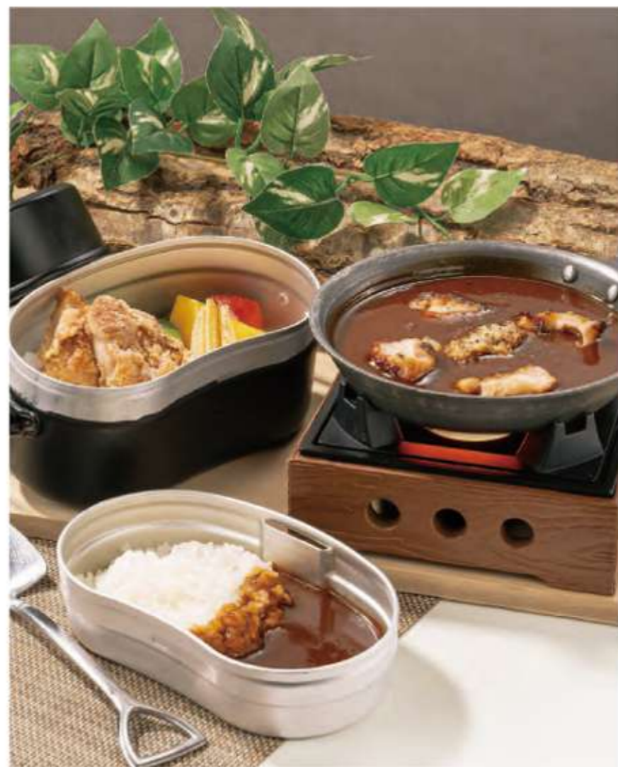
信州きのここと鶏肉のカレーと山賊焼き ¥1,300 (税込¥1,430)