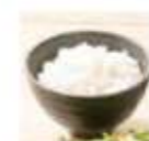
長野県産お米使用 ごはん