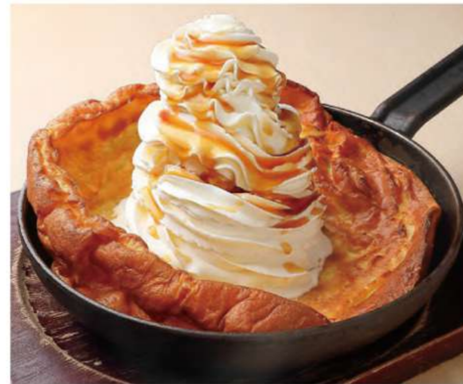
たっぷりクリームの子パンケーキ ¥1,073 (税込¥1,180)