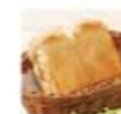
店内焼き 山型パン