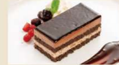
りんごのザッハトルテ セミフレッド仕立て