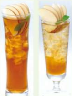
アイスアップル ティー