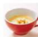
信州ミルクの コーンスープ