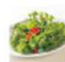
長野県産ケールの サラダ