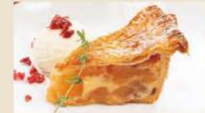
自家製アップルパイ ※アルコール分を含みます。