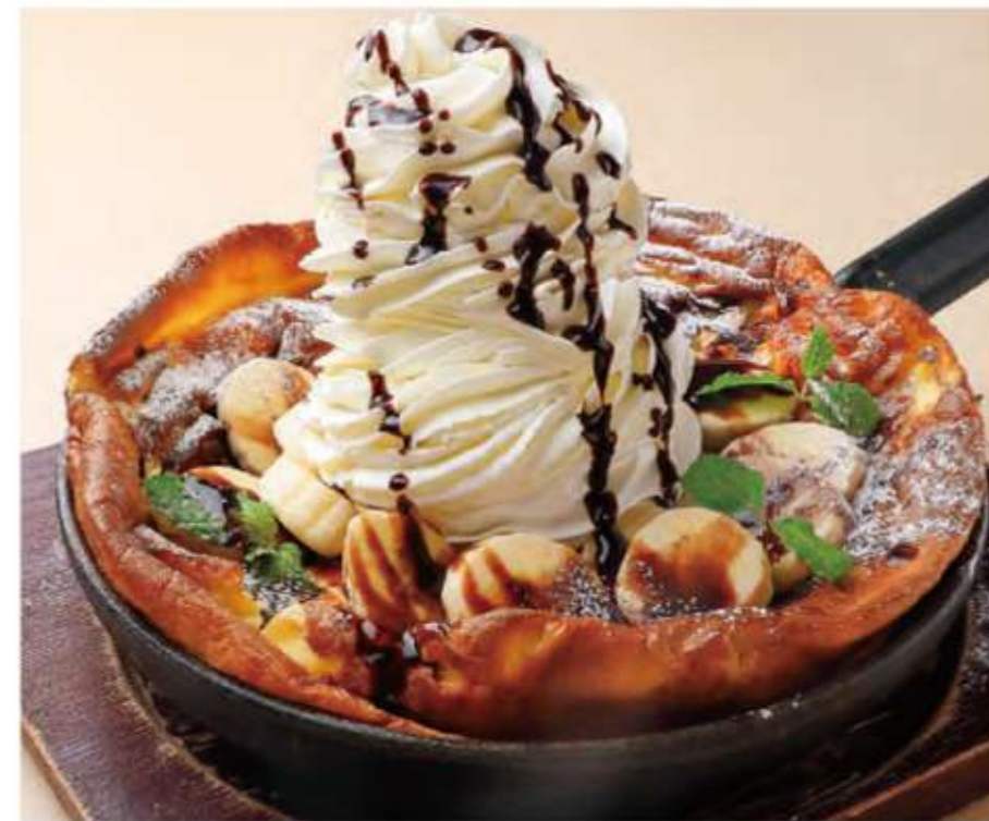
たっぷりクリーム&バナナチョコパンケーキ ¥1,346 (税込¥1,480)