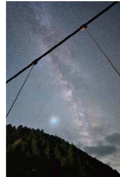
天の川とペルセウス座流星群