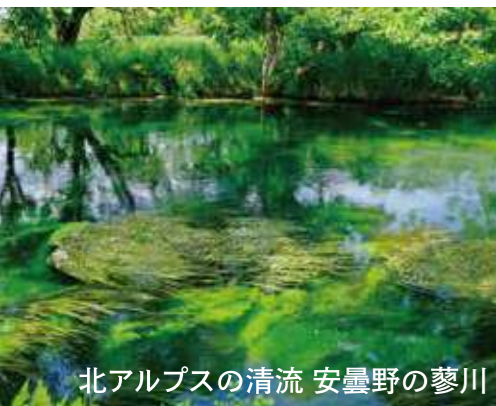
北アルプスの清流 安曇野の蓼川