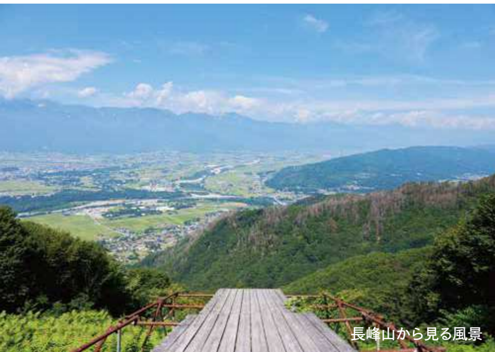
長峰山から見る風景