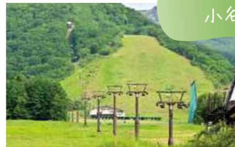
つがいけこうげん 柵池高原

約20分のゴンドラと約7分のロープウェイを乗り継いで高原を登っていきます。途中、ゴンドラやロープウェイの中からも大自然の景観を楽しむことができます。ロープウェイの終点から少し歩くと、柵池自然公園が広がっており、標高1,900mに位置する高原湿原で、夏は冷涼であるため快適に散策することができます。